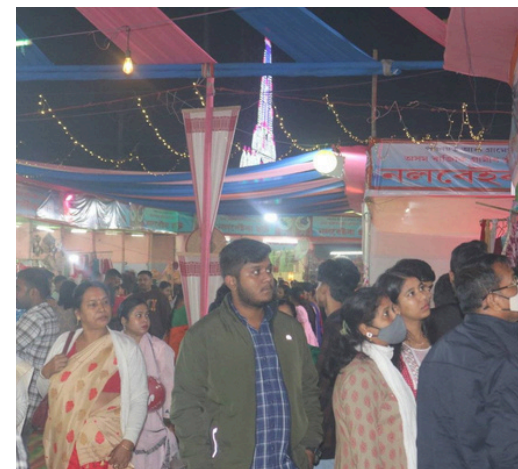
মাজ নিশাও নলবাৰী ৰাসত ব্যাপক ভিৰ, ফটো বৃহস্পতিবাৰৰ