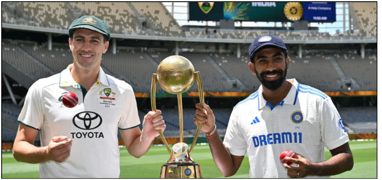
বৰ্ডাৰ গাভাস্কাৰ ট্ৰফীৰ সৈতে অষ্ট্ৰেলিয়াৰ অধিনায়ক পেট কামিন্স আৰু ভাৰতৰ যশপ্ৰীত বুমৰাহ, বৃহস্পতিবাৰে