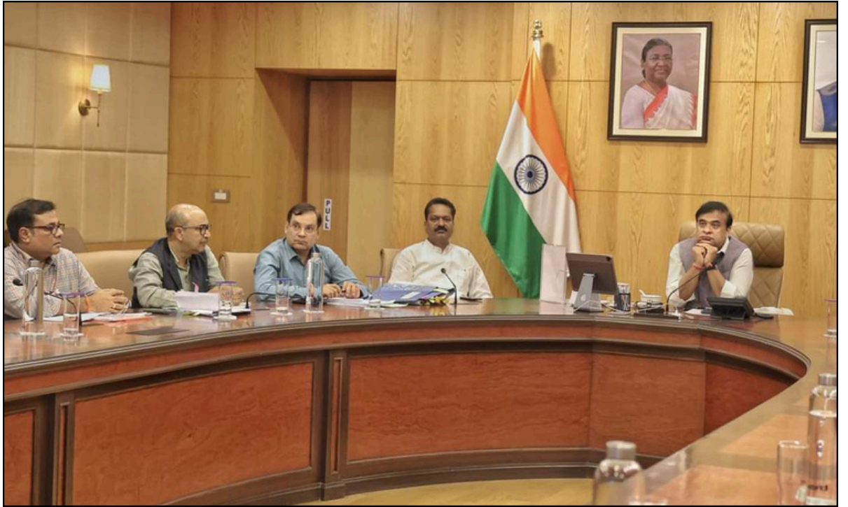
মাজুলী আৰু যোৰহাট সংযোগী ব্ৰহ্মপুত্ৰৰ ওপৰত নিৰ্মীয়মাণ দলংখনৰ কাম-কাজক লৈ মুখ্যমন্ত্ৰীৰ বৈঠক

ই-সংবাদ, মৰিয়নি, ২১ নৱেম্বৰঃ খাদ্যৰ সন্ধানত ওলাই অহা বনৰীয়া হাতীৰ প্ৰায় ৪০-৫০ জনীয়া জাক এটাই নিশা মৰিয়নীৰ খাটিচোনা দিহিঙীয়া গাঁৱত প্ৰবেশ কৰাৰ সময়তে সংঘটিত হয় এক অঘটন। সমীপতে থকা এডৰা বাহনিৰ মাজত থকা জেচিবৰ দ্বাৰা ইটা তৈয়াৰ কৰিবলৈ ব্যৱহাৰ কৰা মাটিৰ বাবে খন্দা এটা উন্মুক্ত পুখুৰীত পৰে ৬টা হাতী। ইয়াৰে ২টা হাতী উঠিবলৈ সক্ষম হয় যদিও ৪টা পোৱালি হাতী পানীৰ মাজতে আৱদ্ধ হৈ ৰয়। পলমকৈ হ'লেও বনকৰ্মী ঘটনাস্থলীত উপস্থিত হয় যদিও অসহায় অৱস্থাতে নিৰ্দিষ্ট দূৰত্বত অৱস্থান কৰে। বুধবাৰে সমগ্ৰ নিশা পানীত আৱদ্ধ হৈ থকাৰ পাছত আজি পুৱা প্ৰায় ৯ মান বজাত পুখুৰীৰ পাৰ কাটি হাতীকেইটাক উদ্ধাৰ কৰা হয়।