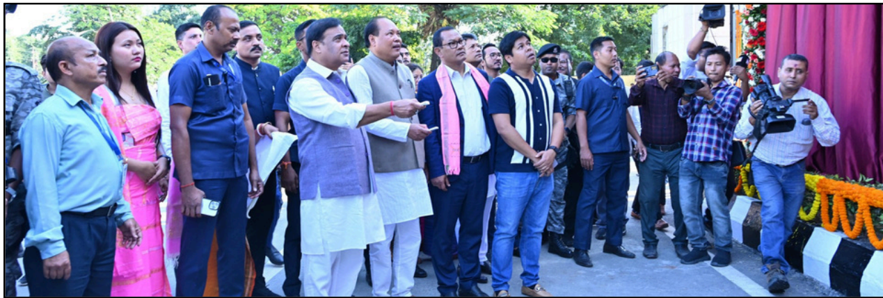
অসম বিধান সভাৰ নতুনকৈ নিৰ্মাণ হোৱা বহুকেইটা প্ৰকল্প উদ্বোধন কৰে মুখ্যমন্ত্ৰীয়ে

আটছাৰ আন্দোলনৰ এদিন পিছতে অইল মেক্সৰ গধুৰ যান-বাহন সমূহ পূৰ্বৰ দৰে চলাচল কৰি থাকে। পৰৱৰ্তী সময়ত আন্দোলনৰ নেতৃত্ব দিয়া এগৰাকী আটছা নেতাৰ বিৰুদ্ধে অইলমেক্সৰ সৈতে গোপন বুজাবুজিৰে ধনৰ লেন দেন কৰাৰ গুৰুতৰ অভিযোগ উত্থাপিত হয়। এই অভিযোগৰ ভিত্তিত আটছাৰ কেন্দ্ৰীয় সমিতিৰ তৰফৰপৰা এক তদন্ত সমিতি গঠন কৰি দিয়া হয়। তদন্ত সমিতিৰ প্ৰতিবেদনৰ ভিত্তিত আটছাৰ টীয়ক শাখাৰ সভাপতিজনক তাৎক্ষণিকভাৱে নিলম্বন কৰা হয়।